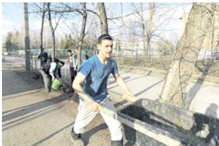
Субботник в Отыабарске

В праздничные дни ЦДУМ России в Уфе, региональные подразделения на местах, редакция газеты «Маглюмат аль-Булгар» организуют коллективные