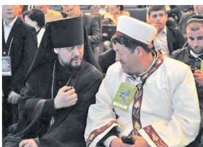
Продолжение темы на с. 13-16

Верховный муфтий сообщил, что вопросы развития традиционного ислама в регионе будут обсуждаться на II мусульманском форуме 11-12 мая. Краевая столица вторично принимает участников грандиозного мероприятия, послужившего началом объединения мусульман всего ДФО.