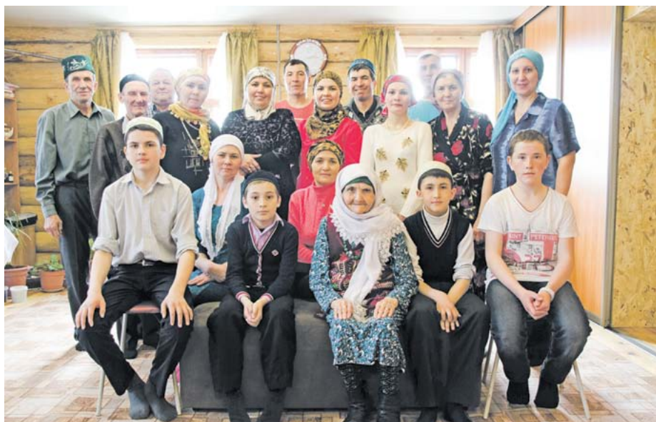
Это родня только из этой деревни, а в прошлом году на юбилей зур әни со всех мест собралось больше 120 человек